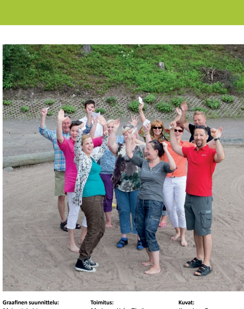
Graafinen suunnittelu: Mairi Nieminen Up-to-Point Oy www.uppoint.fi