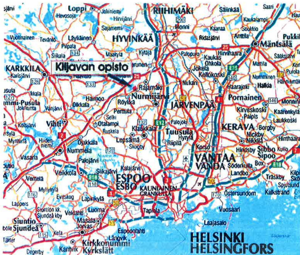
Genimap Oy (L2167)

Opiston bussipysäkeiltä Rajamäki-Röykkä-tieltä on opistolle noin puolen kilometrin kävelymatka.