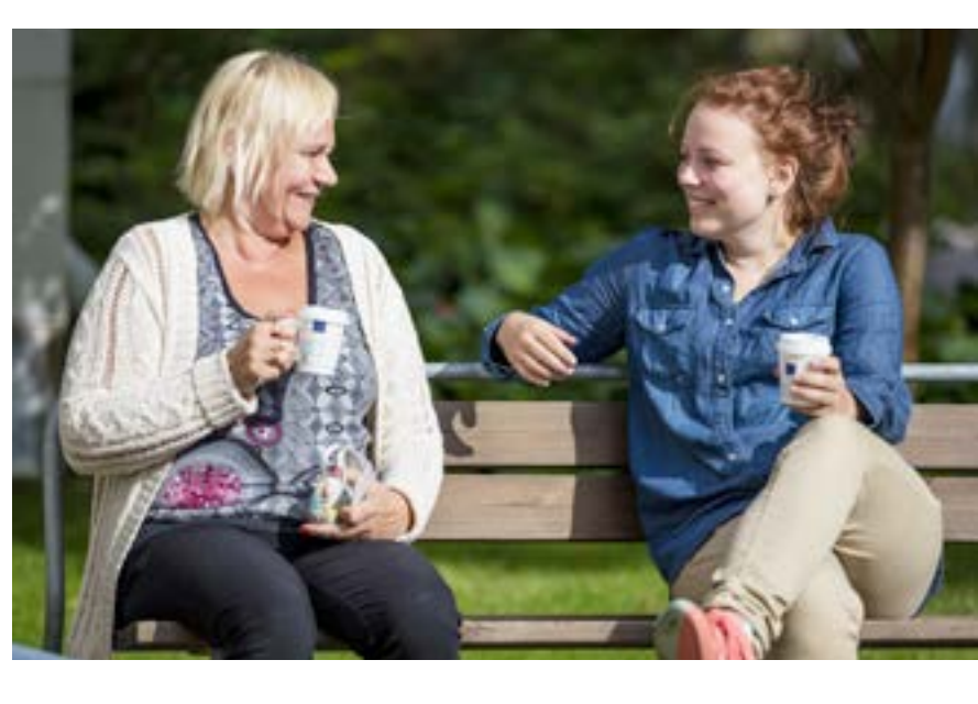
Graafinen suunnittelu: Maanostomisto Up-to-Point Oy www.uptopoint.fi Toimitus: Marjanna Liehu-Törö, Riitta Karjalainen